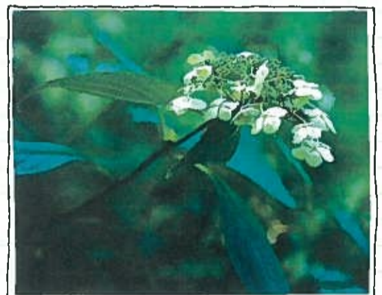
アマチャ(甘茶) ユキノシタ科

→ ヤマアジサイの変種で生の葉は甘くないが乾燥させると、砂糖の数百倍の甘みが出る。カロリーは無し。 生薬としては抗アレルギー作用や歯周病に効果がある。